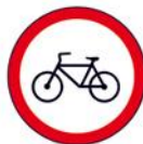
ZABRANA PROMETA ZA BICIKLE