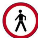
ZABRANA PROMETA ZA PJEŠAKE