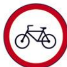
ZABRANA PROMETA ZA BICIKLE